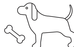
Hund, hvem har taget dit kødben?