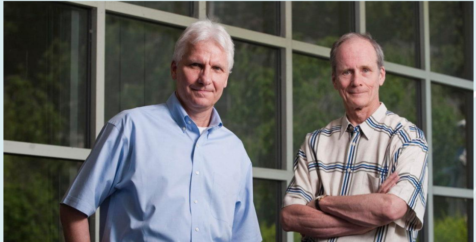
Richard M. Ryan and Edward L. Deci