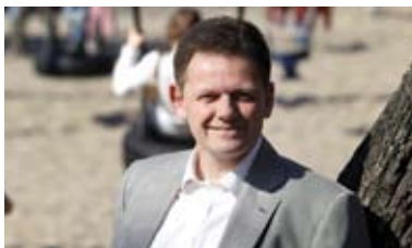
Lars Barfoed Minister for Familie- og Forbrugeranliggender

Regeringen ønsker med denne første familiepolitiske redegørelse at starte en debat om, hvordan der skabes en afbalanceret sammenhæng mellem familie-, fritids- og arbejdsliv, hvordan de offentlige tilbud skal indrettes for at imødekomme moderne familiers behov, og hvor grænsen skal gå mellem familiens og det offentlige ansvar. Det vedrører os alle.