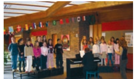
"Hold op med at drille, hold op med at slå. Vi gider det ikke, det må du forstå," sang børnene i Peder Lykke Skolens kor ved underskrivelsesceremonien

Som optakt til Trivselsklæringens 1 års dag den 10. marts 2005 udsendte DCUM, som sekretariat for Det Nationale Samarbejde, et idékatalog i december 2004. Her kan landets skoler hente inspiration til lokale markeringer af en fælles indsats for social trivsel og mod mobning.