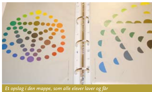
Et opslag i den mappe, som alle elever laver og får

I faget arbejdsmiljø er eleverne ved at afslutte en opgave. Arbejdsmiljøopgaven kan eleverne lave alene eller i grupper. Flere har valgt at skrive om psykisk arbejdsmiljø og mobning, hvilket blandt andet kan