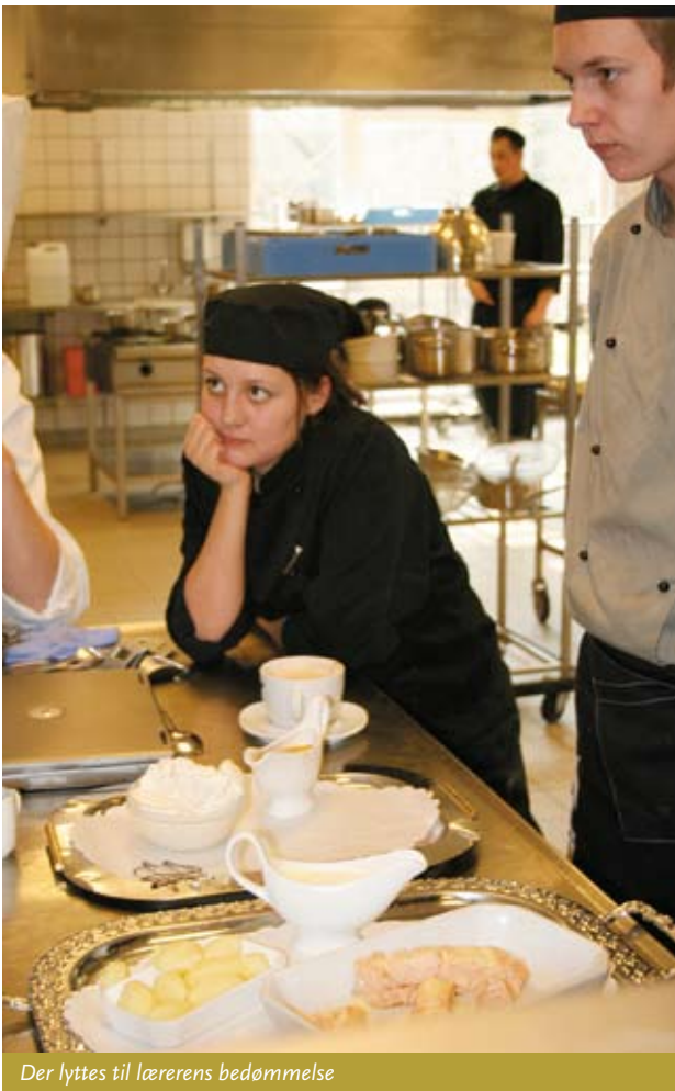
Der lyttes til lærerens bedømmelse

gende. Det er noget helt andet ude i det rigtige køkken – der er travlt, fortsætter han.