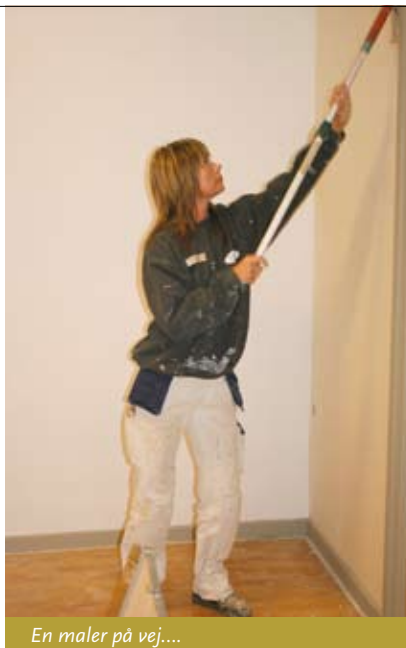
En maler på vej...