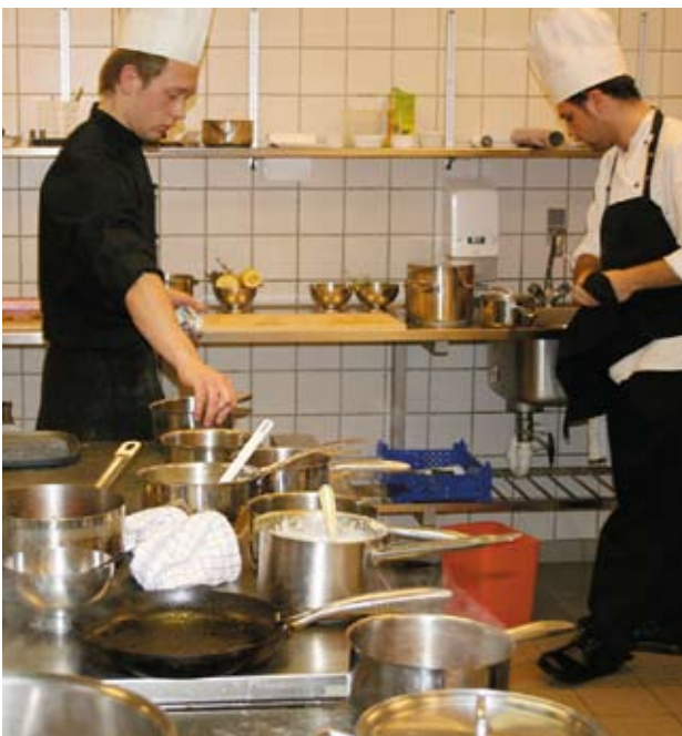
Gang i gryderne!

tydeligt, at de kan lide at arbejde alene, selvom det kan give nogle problemer med timingen på alle retterne. Nogle har meget travlt, mens andre har mere ro på – og endda overskud til at vælge ny musik på den medbragte pc.