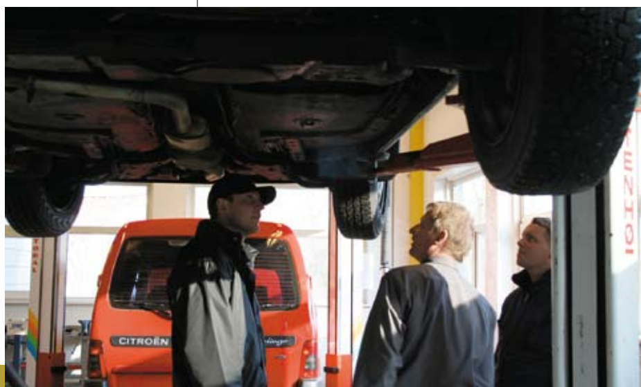
Hjulet beskues fra alle vinkler

Frokosten kalder, men en flok elever vælger at bruge deres frokostpause bøjet over motoren på den netop undersøgte bil: Fedt, vi fik ordnet den sag! Man har vel lov at nyde sit værk!