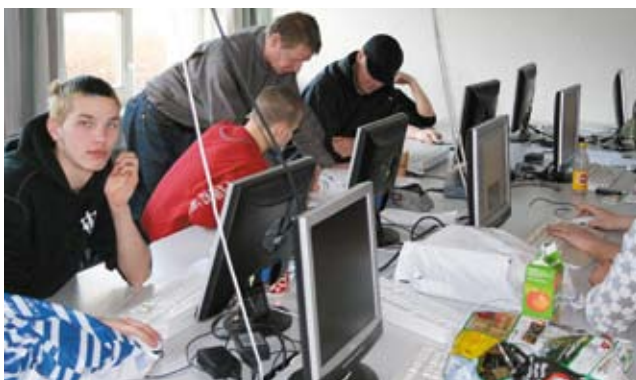
Den skriftlige opgave...

stræbende, i gang med opgaven, som skal afleveres ca. tre timer senere. De bliver nødt til at klø på.