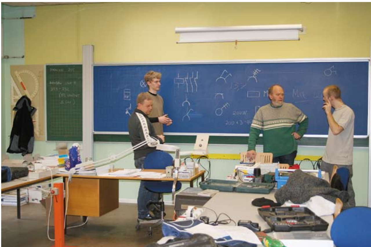
El er også teori og formler...

Eleverne kan lide at være på skolen. De, der kommer direkte fra folkeskolen, er vilde med undervisningsform.