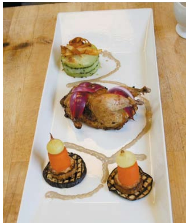
Så er der serveret: Poussin i bikini!

Det er mad, det er kunst, det er hot! Det er intenst, det er god smag, og så er det timing, så det klodser!