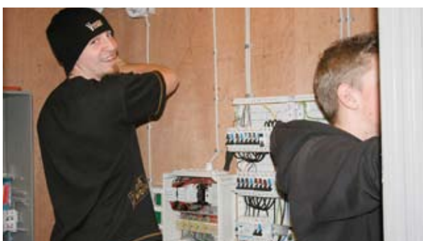
Der arbejdes to og to i de små 'huse'

Nogle elever bliver kaldt 'vilddyrene', selvom de nu virker ret fredelige. 'Vilddyrene' har dog styr på radioen, der sender musik ud i værkstedet, som undervisningslokalet fungerer som. Desuden er der gang i skruemaskinerne, der skal nemlig sættes gipsplader op, samtidig med at den seneste elinstallation skal tjekkes – med strøm på.