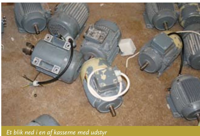
Et blik ned i en af kasserne med udstyr

forlænges. Når grundforløbet er bestået fortsætter uddannelsen med en kontrakt på et praktiksted.