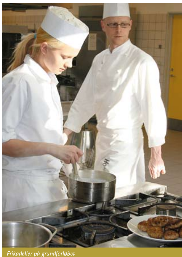
Frikadeller på grundforløbet

Der er fire kogeøer – svarende til fire køkkener – i dette store køkken, og her arbejder eleverne i grupper om dagens ret. Det summer af aktivitet, snak