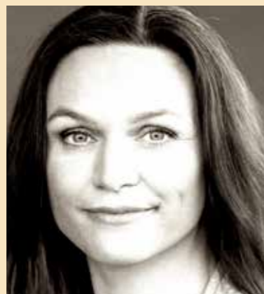
— Merete Riisager Undervisningsminister